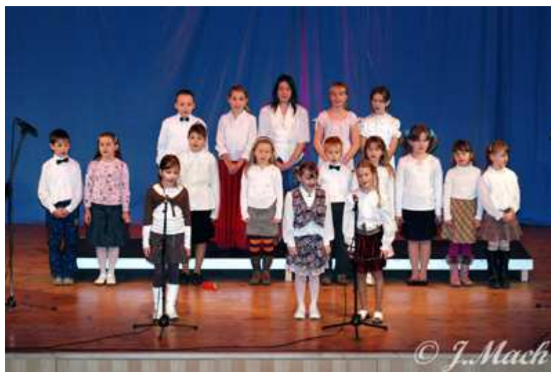
Pěvecký sbor školy Pěváček