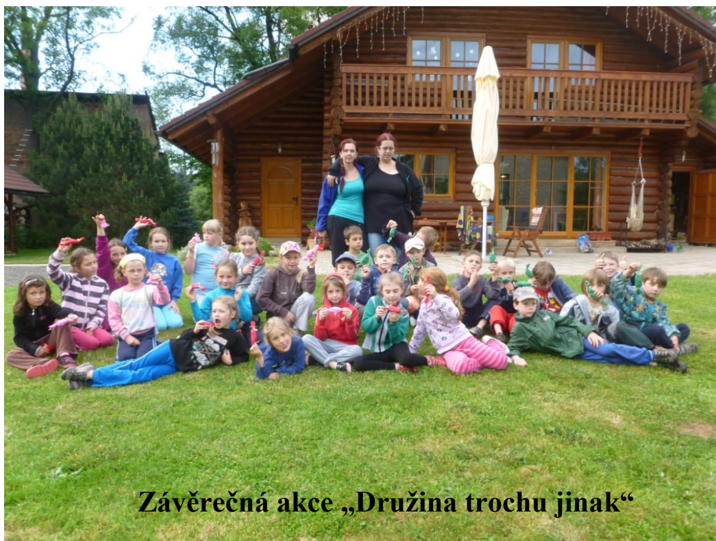
Závěrečná akce „Družina trochu jinak“

Po celý rok obě oddělení velice dobře spolupracovala jak na akcích, tak i při běžném provozu školní družiny.